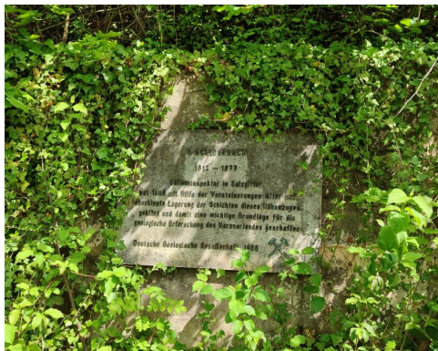
Am Harly bei Vienenburg aufgenommen.

https://de.wikipedia.org/wiki/Albert_Schloenbach